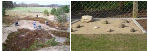
Rest-Binnendüne als natürlicher Lebensraum und Ersatzfläche im Garten