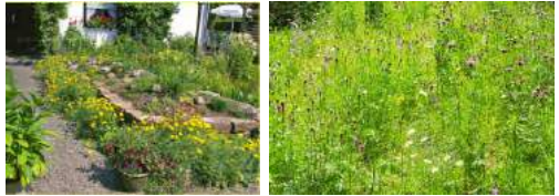
Besser so!