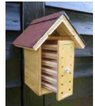
Beobachtungsröhren aus atmungsaktivem Holz, nur teilweise mit Acrylglas abgedeckt

Markhaltige Stängel, die man waagrecht anbringt, werden von Wildbienen in der Regel nicht angenommen (s. Abschnitt 3.8).