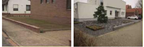
Lebensraum für Wildbienen?

Blumenwiesen dürfen nicht gedüngt werden!!!