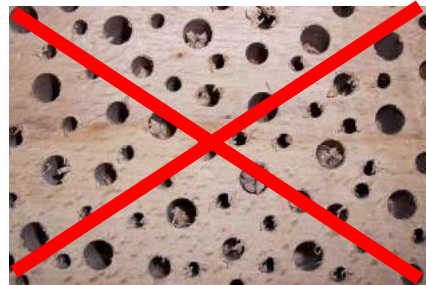
Hier gehen keine Wildbienen rein!