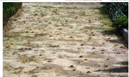
Massenvorkommen der Raufüßigen Hosenbiene Dasygaster hirtipes